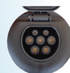
PRESA DI TIPO 2