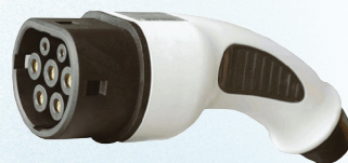
CONNETTORE DI TIPO 2